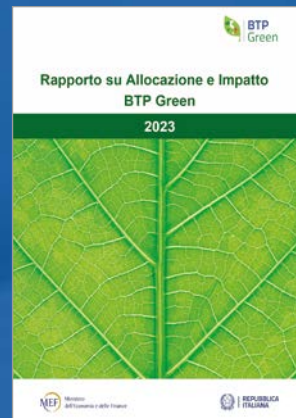
RAPPORTO SU ALLOCAZIONE E IMPATTO BTP GREEN