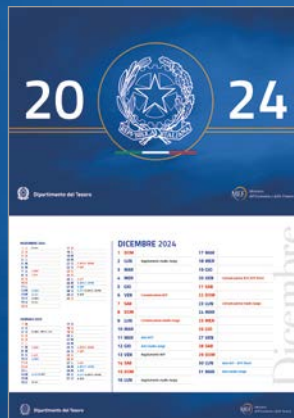
CALENDARIO DELLE ASTE DEI TITOLI DI STATO