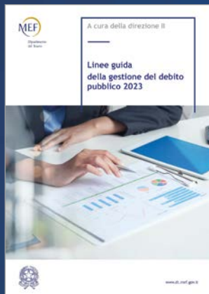
LINEE GUIDA DELLA GESTIONE DEL DEBITO PUBBLICO