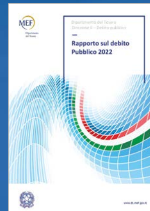
RAPPORTO SUL DEBITO PUBBLICO

Per informazioni ed aggiornamenti: www.dt.mef.gov.it/it/debito_publico